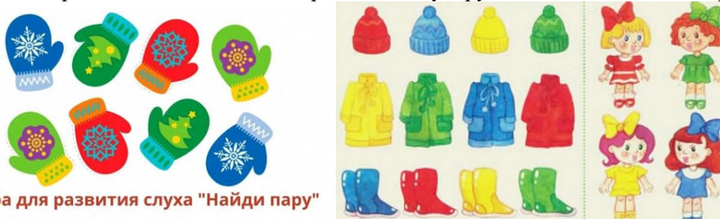
Игра для развития слуха "Найди пару"

Взрослый просит малыша найти на картинке шапку и рукавички с одинаковым орнаментом.